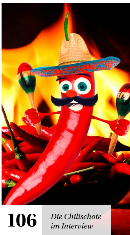
106 Die Chilischote im Interview

Eine K(I)asse für sich! Um Kasse zu machen, braucht man das richtige Kassensystem ..... 86