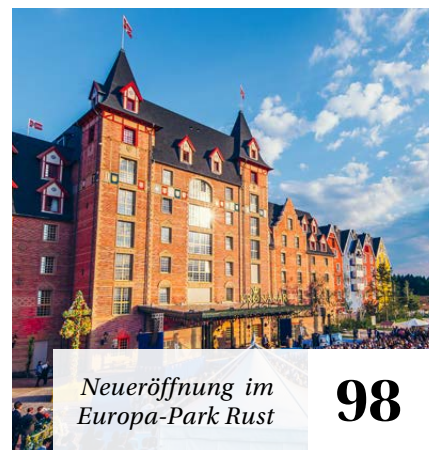
Neueröffnung im Europa-Park Rust 98