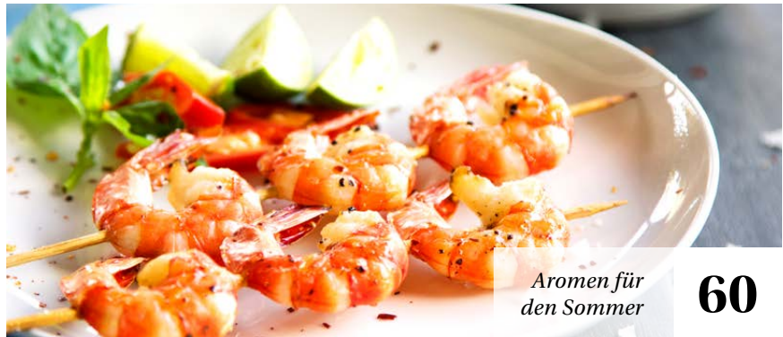
Aromen für den Sommer 60

Auf Knopfdruck versorgt Über die neuesten Entwicklungen bei Verkaufsautomaten in der Hotellerie ..... 82