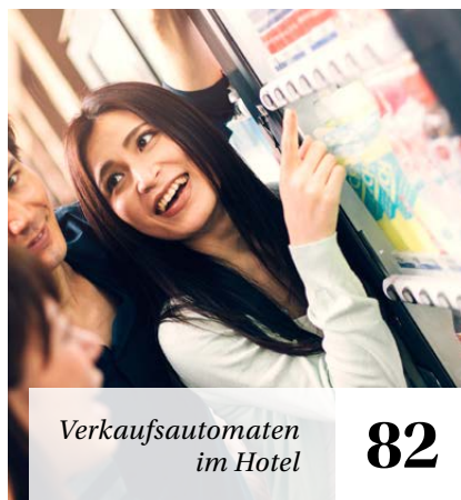
Verkaufsautomaten im Hotel 82